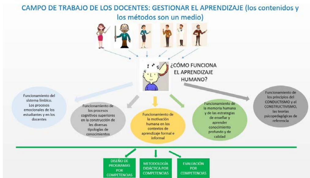
Imagen 3. Implicaciones pedagógicas como resultado de situarse en la perspectiva del aprendizaje

han influido en la investigación del aprendizaje, el conductismo, por un lado, y el constructivismo, por el otro, como teoría referenciales.