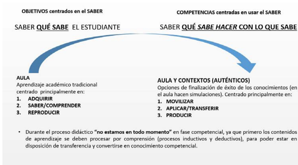
Imagen 1. Diferencias entre los objetivos centrados en el saber y las competencias centradas en saber hacer

La competencia educativa, tanto si se trata de competencia clave como si hablamos de competencias específicas de las disciplinas (competencias epistemológicas), no separa el conocimiento de su uso, no escinde la teoría de la práctica, sino que la trasciende. Su adquisición no se plantea como un todo o nada, sino que es una cuestión de grado: se puede ser más o menos competente, todo dependerá de las múltiples variables que definen su implementación. En todo caso, la competencia no existe hasta que se demuestra en la acción. En este sentido un autor de referencia, el profesor Ángel Pérez Gómez 7 , define cinco grandes atributos que definen la competencia educativa: transferibilidad, integración de conocimientos, contextualización/solución a demandas concretas, disposición y actitud, y reflexión autorreguladora.